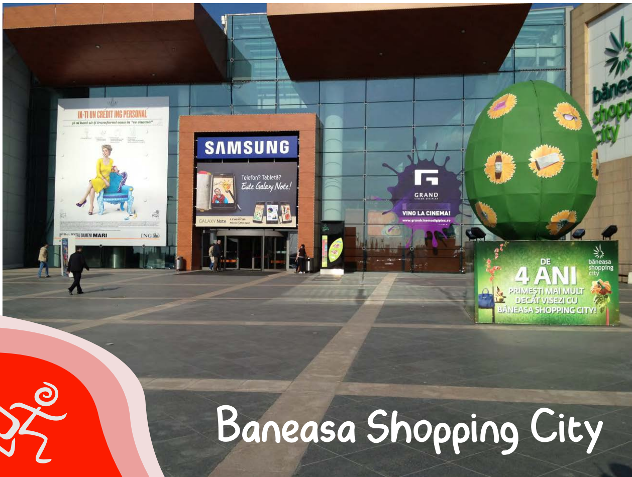
Baneasa Shopping City